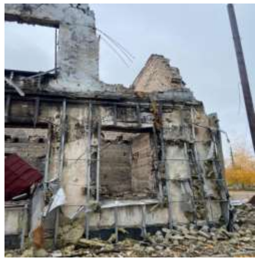
Вугледарський міський суд Донецької області- будівля суду зруйнована.