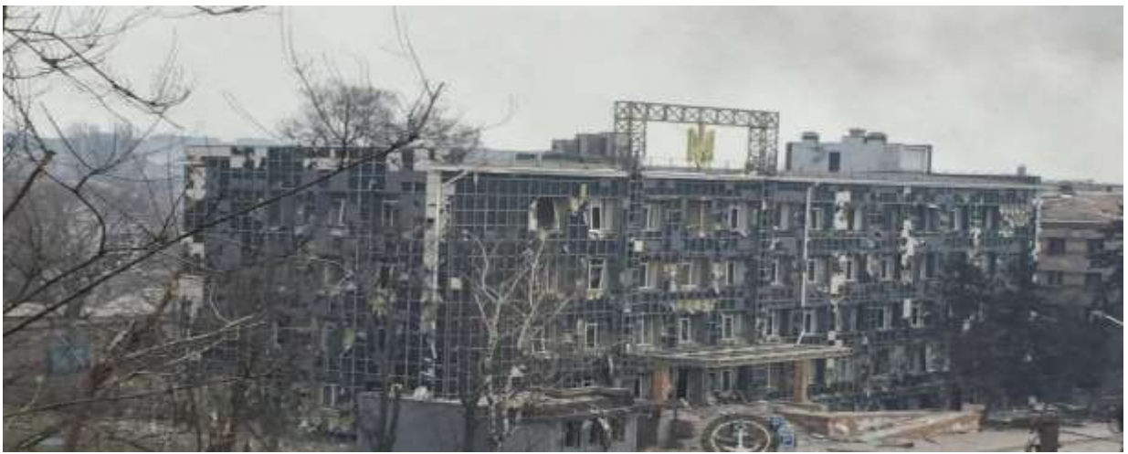
Краснолиманський міський суд Донецької області- будівля суду зруйнована.